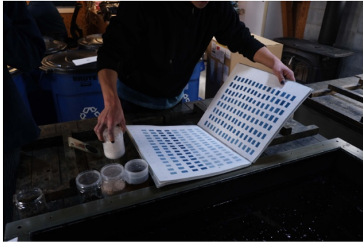
Indigo, Shikoku II.26

organiques" consacrée aux couleurs et à la teinture.