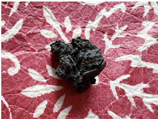
Indigo, Shikoku II.26

www.harumitextile.com www.couleur-garance.com