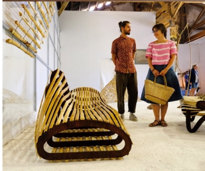
@F. Jouliau (Exposition Entrelacs 2024)

15:30-17h Travail du bambou à partir de modèles issus des collections du MUCEM et des objets rapportés du Japon, d'Afrique, du Massif des Maures et d'Italie.